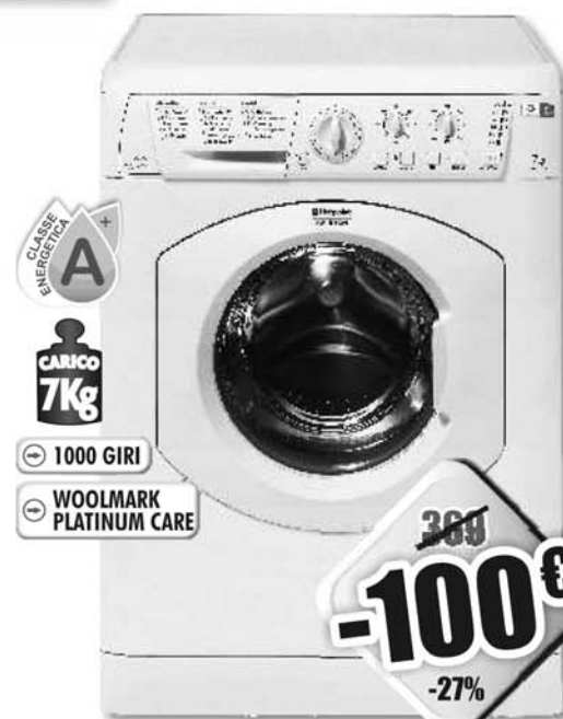
HOTPOINT ARISTON ARXXL105IT - LAVATRICE A carica frontale, classe A+ di efficienza energetica, capacità di carico fino a 7kg, centrifuga regolabile fino a 1000 giri, partenza ritardata, lavaggio speciale lana Woolmark Platinum Care, sicurezza anti-trabocco, dim.: A 85, L 60, P 58 cm

I prezzi riportati sono comprensivi di Eco-contratto RAEE e validi nel Punto Vendita da partecipare all'iniziativa. Le offerte sono valide dal 24 Maggio al 06 Giugno 2013. Sono esclusi gli articoli di esaurimento scorte. La foto sono a scopo puramente indicativo.