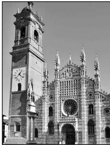
Il duomo di Monza.