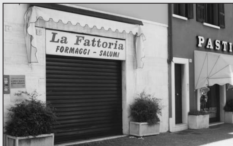
Il nuovo negozio in Piazza Treccani (ex negozio La Fattoria).

Piazza Treccani (ex negozio La Fattoria)