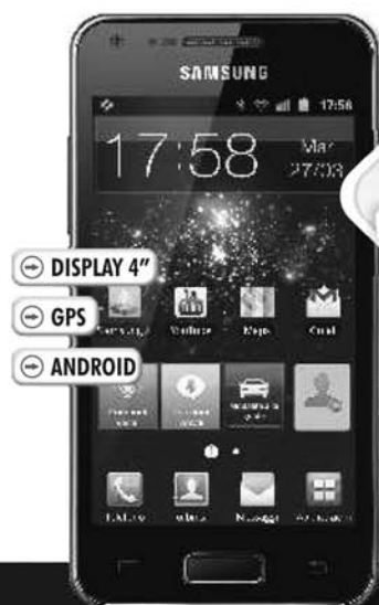
SAMSUNG GT-I9070- GALAXY S ADVANCE SMARTPHONE HSDPA 14.4 Mbps, HSUPA 5.76 Mbps, Quad-Band, Touchscreen da 4" SUPERAMOLED, fotocamera da 5 MP, Bluetooth® 3.0, Wi-Fi, GPS, Android 2.3 (colori bianco e nero)