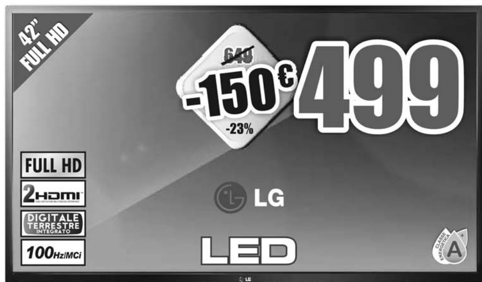
LG 42LN5400 TV LED 42" FULL HD Risoluzione 1920x1080, tecnologia 100 Hz/MCI, decoder digitale terrestre integrato in HD, 2 HDMI, USB, MHL, audio stereo Virtual Surround, classe energetica A+