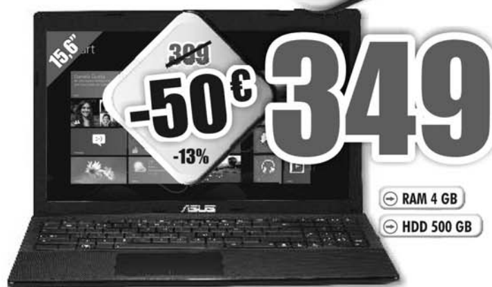
ASUS F55A-SX201H - NOTEBOOK Windows 8 Processore INTEL Dual Core 1000M, RAM 4GB, HDD 500GB, display da 15,6", HD GLARE LED, masterizzatore DVD DL, Windows 8