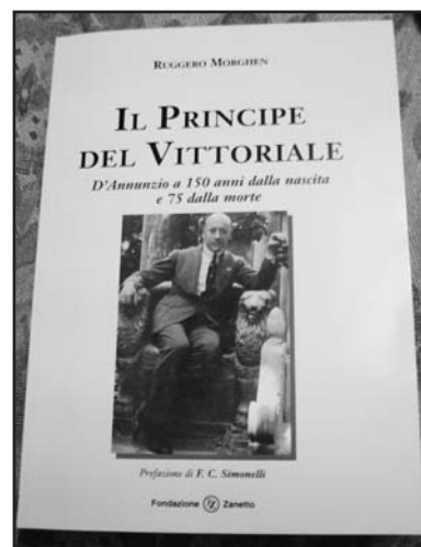
La copertina del libro.

L'impresa fiumana, con quella apoteosi di grandezza imperiale e di rovinosa caduta successi-