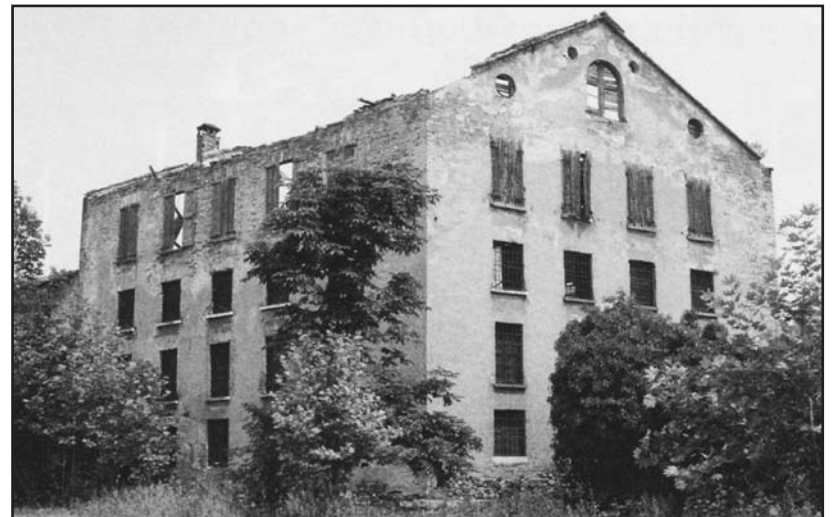
Montichiari, il vecchio edificio detto "Galetér" in Borgosotto. Il complesso, dove avveniva l'ammasso dei bozzoli, era di proprietà dell'ENTE NAZIONALE FIBRE TESSILI, e solo dopo lunghe difficoltà fu acquistato dal Comune sotto l'Amministrazione Badilini.

Il vorace e inquieto filugello, chiamiamolo finalmente anche con quest'altro nome più poetico, cessa di nutrirsi, si fa lento e incerto nei movimenti, sembra perfino triste. Si muove qua e là, vaga da rametto a rametto del "bosco". Qualcuno si allontana, solo, quasi in consapevole solitudine prima di