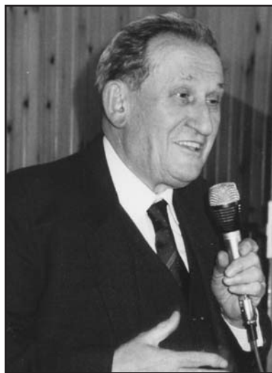
Il sen. Mario Pedini.

Certamente MARIO PEDINI, il senatore, è stato fra i cittadini più illustri di Montichiari degli ultimi secoli, monteclarense doc nato e immerso nella sua comunità, almeno per quanto gli permettevano i suoi impegni parlamentari e di governo e i suoi interessi culturali di cittadino del mondo.